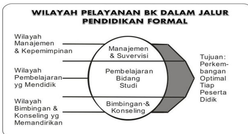
Gambar 3. Porsi Bimbingan Dan Koseling Dalam Jalur Pendidikan

Untuk mengetahui tentang porsi Bimbingan dan Koseling dalam pendidikan, maka bisa dilihat melalui gambar wilayah pelayanannya dalam jalur pendidikan sebagai berikut :