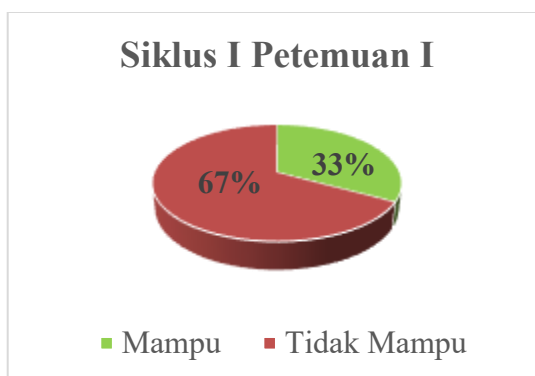
Gambar 1 Grafik Kemampuan Menulis Siklus I Pertemuan I

Berdasarkan Gambar 1, diagram kemampuan pembelajaran siklus I pertemuan I di atas, dinyatakan dari 15 siswa jumlah yang mencapai indikator keberhasilan penilaian dikategorikan mampu berjumlah 5 siswa atau 33% dan siswa yang dikategorikan tidak mampu berjumlah 10 siswa atau 67%. Hal ini perlu adanya perbaikan tindakan pada pertemuan selanjutnya. Berdasarkan data tersebut dapat disimpulkan bahwa kemampuan menulis karangan narasi pada siklus I pertemuan I belum memenuhi ketuntasan maksimal.