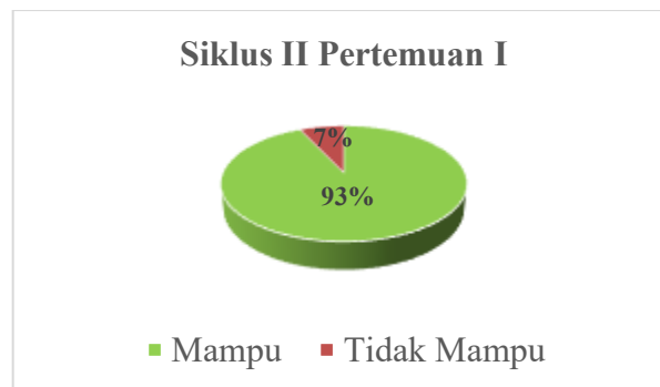
Gambar 3 Grafik Kemampuan Menulis Siklus II Pertemuan I

Penilaian kemampuan siswa pada siklus I pertemuan II dalam menulis karangan narasi di kelas IV SDN 2 Kabila , terdapat 3 aspek penilaian yaitu aspek isi, aspek struktur, ejaan dan tanda baca. Adapun hasil grafik kemampuan menulis siswa pada siklus I dan kedua sebagai berikut.