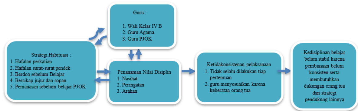
Gambar 4. Diagram Konteks Habitiasi

Ilustrasi pada Gambar 4 menunjukkan bahwa, terlihat bahwa strategi habituasi dirancang melalui serangkaian kegiatan pembiasaan yang terintegrasi dengan penanaman nilai disiplin oleh guru. Guru berperan dalam mengarahkan dan memperkuat nilai melalui nasihat, peringatan, serta arahan yang diberikan secara berkesinambungan kepada siswa. Namun, dalam implementasinya terdapat kendala berupa ketidakteraturan pelaksanaan yang dipengaruhi oleh keterbatasan waktu dan penyesuaian terhadap kondisi tertentu. Diagram tersebut juga menunjukkan bahwa kurangnya dukungan dari orang tua turut memengaruhi keberlangsungan pembiasaan, sehingga kedisiplinan belajar siswa belum terbentuk secara stabil dan masih memerlukan dukungan strategi lain yang lebih konsisten.