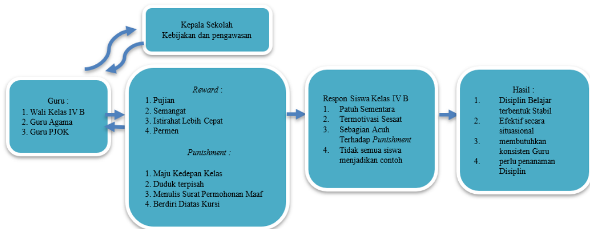
Gambar 3. Diagram Konteks Pemberian Punishment dan Reward

Berdasarkan Gambar 3, terlihat bahwa penerapan reward dan punishment melibatkan peran guru serta dukungan kebijakan dan pengawasan dari kepala sekolah sebagai bagian dari pengelolaan disiplin belajar. Strategi ini menampilkan dua pendekatan yang saling melengkapi, yaitu pemberian penghargaan untuk mendorong perilaku positif dan pemberian sanksi untuk mengendalikan pelanggaran yang terjadi. Respons siswa menunjukkan adanya perubahan perilaku yang bersifat situasional, seperti kepatuhan sementara dan peningkatan motivasi, namun tidak merata pada seluruh siswa. Diagram tersebut juga mengindikasikan bahwa hasil yang dicapai belum sepenuhnya stabil, sehingga efektivitas strategi ini masih memerlukan konsistensi guru serta penguatan melalui penanaman nilai disiplin yang berkelanjutan.