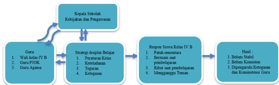
Gambar 2. Diagram Konteks Pelaksanaan Peraturan Kelas Secara Konsisten

Mengacu pada Gambar 2, terlihat bahwa pelaksanaan peraturan kelas melibatkan peran berbagai pihak, mulai dari guru hingga kepala sekolah melalui kebijakan dan pengawasan yang saling terintegrasi. Strategi disiplin belajar tidak hanya berfokus pada aturan, tetapi juga mencakup keteladanan, teguran, dan ketegasan sebagai satu kesatuan dalam mengarahkan perilaku siswa. Interaksi tersebut menghasilkan respons siswa yang beragam, mulai dari kepatuhan sementara hingga munculnya perilaku yang kurang sesuai selama pembelajaran. Diagram ini juga menunjukkan bahwa hasil yang dicapai belum sepenuhnya stabil, sehingga kedisiplinan siswa masih dipengaruhi oleh tingkat ketegasan dan konsistensi guru dalam menerapkan strategi yang ada.