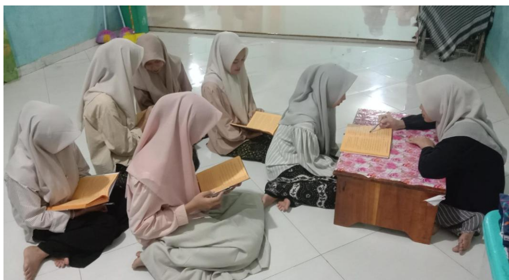
Gambar 1. Pelaksanaan Metode Sorogan Santri Sunan Muria Putri

Berdasarkan Tabel 1, pelaksanaan metode sorogan berlangsung melalui tiga tahapan, yaitu tahap persiapan, pelaksanaan, dan evaluasi. Pada tahap persiapan, santri mempelajari materi yang akan disetorkan. Pada tahap pelaksanaan, santri membaca dan menjelaskan isi kitab di hadapan ustadzah. Selanjutnya, pada tahap evaluasi, ustadzah memberikan penilaian dan umpan balik terhadap kemampuan membaca dan pemahaman santri. Berikut ini dokumentasi kegiatan pelaksanaan metode sorogan pada santri yang dapat dilihat pada Gambar 1.