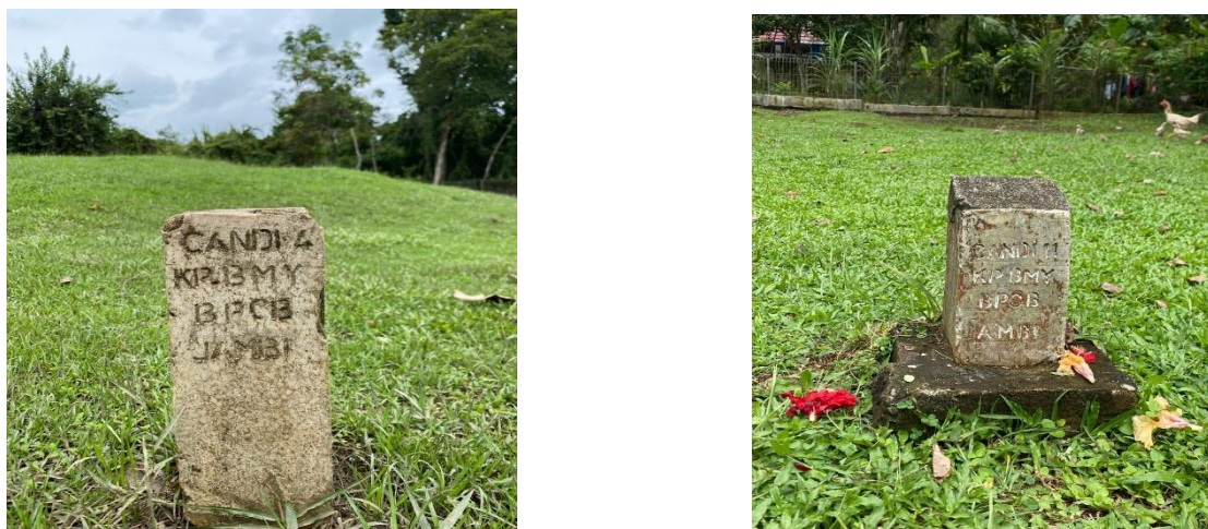
Gambar 2. Candi4 dan Candi11

Proses pelestarian terdapat dalam pemugaran pada candi1, candi2, candi3, candi7, dan candi8, melalui beberapa tahapan yang melibatkan pengelola pihak situs candi bumi ayu dan juga instansi pelestarian cagar budaya. Kegiatan pelestarian meliputi konservasi, perawatan rutin, dan pengawasan pihak kawasan situs candi bumi ayu. Masyarakat sekitar situs turut berperan dalam menjaga kebersihan dan keamanan, diketahui bahwa situs candi bumi ayu merupakan pusat wisatawan budaya dalam memberikan informasi yang interaktif untuk pengunjung khususnya pelajar.