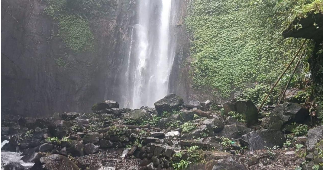
Gambar 2. Air Terjun Coban Cunggu

dengan pola hubungan yang lebih individualistik dan berorientasi pada pencapaian keberhasilan ekonomi pribadi yang kompetitif.