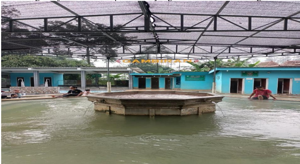
Gambar 1. Sumber mata air gambiran/Pemandian air panas

Transformasi kawasan Mata Air Padusan di lereng Gunung Welirang mencerminkan perubahan mendalam pada cara masyarakat memaknai ruang hidup mereka. Pada awalnya, sumber air panas seperti Sumber Gambiran dianggap sebagai ruang sakral yang memiliki nilai spiritual dan metafisik yang sangat kuat bagi penduduk lokal. Masyarakat rutin melakukan praktik ritual dengan membawa sesaji atau bunga sebagai bentuk penghormatan terhadap kekuatan alam yang diyakini mampu memberikan penyembuhan fisik maupun batin. Namun, seiring berjalannya waktu dan meningkatnya kebutuhan ekonomi, pemaknaan ruang yang sebelumnya didominasi oleh nilai-nilai mistis perlahan mulai bergeser ke arah rasionalitas. Ruang yang dulunya dianggap suci kini didefinisi menjadi objek wisata yang memiliki nilai jual komersial tinggi bagi pengunjung dari luar daerah. Proses desakralisasi ini menandai babak baru di mana air murni dari alam tidak lagi hanya berfungsi sebagai sarana spiritual, tetapi telah diproduksi ulang menjadi komoditas pariwisata yang dikelola demi keuntungan finansial.