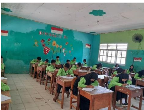
Gambar 1. Kegiatan pembelajaran PAI di kelas VIII

Al-Qur'an di depan kelas karena mereka merasa lebih mampu dalam melafalkan bacaan dengan baik dan benar. Meskipun demikian, masih terdapat beberapa peserta didik yang memerlukan bimbingan lebih lanjut, terutama dalam membedakan huruf-huruf tertentu dan menjaga ketepatan pengucapan saat membaca ayat panjang. Oleh karena itu, guru terus memberikan latihan membaca secara rutin dan pembinaan individual agar kemampuan fashahah peserta didik dapat meningkat secara bertahap. Gambaran proses tersebut dapat dilihat pada Gambar 1.