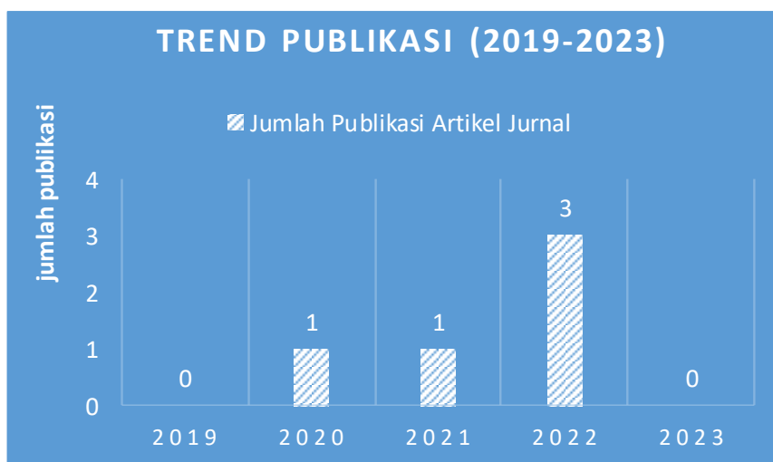
Gambar 1. Publikasi Artikel

Jumlah publikasi dapat memberikan gambaran tentang perkembangan topik penelitian. Grafik di bawah ini menunjukkan tren penelitian tentang peran Islamic Boarding School (IBS) wadah Pembentukan Karakter dari tahun 2019 hingga 2023.