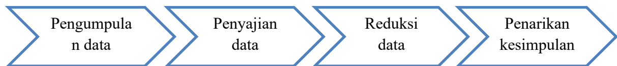
Gambar 2. Model analisis data Miles and Hubberman

Pada teknik wawancara, jenis wawancara yang digunakan oleh peneliti yaitu indepth interview atau wawancara secara mendalam serta dilengkapi dengan bahan dan pokok permasalahan. Berikut ini merupakan tahapan yang telah dilakukan oleh peneliti mulai dari tahap perencanaan hingga penarikan kesimpulan.