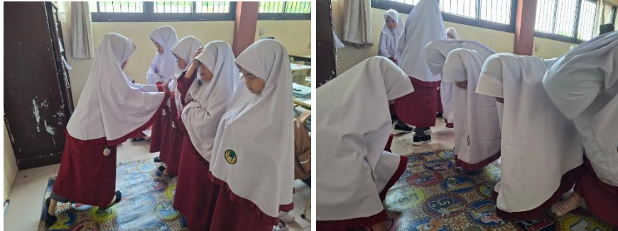
Gambar 1. Interaksi tutor sebaya dalam membimbing teman saat praktik salat

kepada anggota kelompok selama melakukan praktik. Gambaran visual mengenai aktivitas tersebut disajikan pada Gambar 1.