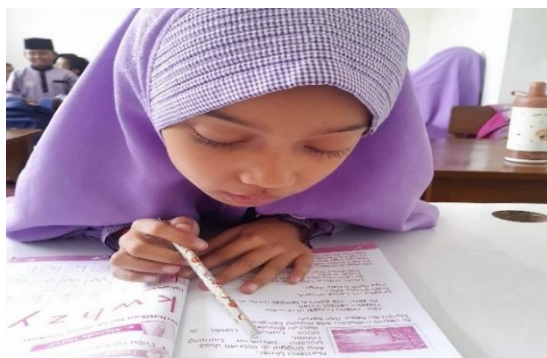
Gambar 1. Kegiatan Pendampingan Guru Kepada Siswa Kelas I yang Mengalami Hambatan Membaca

Urutan temuan yang diperoleh selama penelitian memperlihatkan perubahan perilaku siswa seiring berlangsungnya aktivitas membaca di kelas. Pada tahap awal, siswa tampak ragu ketika diminta membaca secara mandiri dan belum berinisiatif melafalkan kata tanpa arahan guru. Setelah guru memberikan bantuan melalui penunjukan tulisan, pembimbingan pelafalan kata, dan pengarahan membaca secara bertahap, siswa mulai mengikuti bacaan serta menunjukkan keberanian untuk mencoba membaca meskipun pelafalannya belum sepenuhnya lancar. Rangkaian kejadian tersebut merupakan pola yang diamati secara berulang selama proses pengumpulan data sehingga menjadi bagian dari temuan empiris penelitian. Dokumentasi pelaksanaan pendampingan selama pembelajaran ditampilkan pada Gambar 1 untuk memberikan gambaran visual mengenai bentuk interaksi yang berlangsung antara guru dan siswa ketika kegiatan membaca dilakukan.