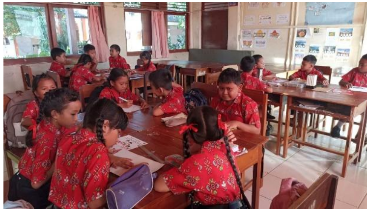
Gambar 3. Peserta Didik Berdiskusi untuk Membuat Poster

Hasil penelitian menunjukkan bahwa evaluasi pembelajaran dilakukan secara berkelanjutan selama proses dan setelah kegiatan pembelajaran berlangsung. Berdasarkan hasil observasi, wawancara, dan studi dokumentasi, guru tidak hanya melakukan penilaian terhadap hasil akhir pembelajaran, tetapi juga mengamati keterlibatan peserta didik selama kegiatan diskusi, presentasi, pembuatan poster, dan refleksi pembelajaran. Evaluasi dilakukan melalui observasi aktivitas peserta didik, hasil kerja kelompok, presentasi, lembar refleksi, serta dokumentasi pembelajaran.