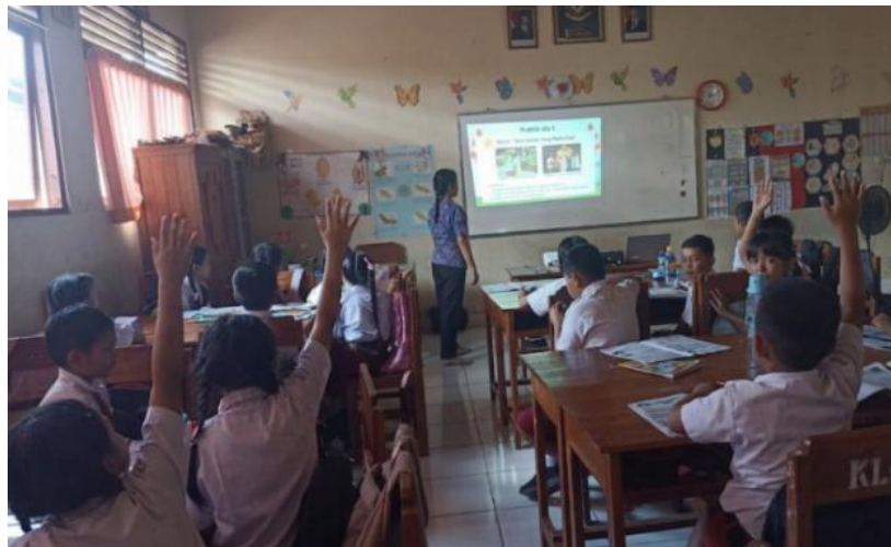
Gambar 1. Keaktifan Peserta Didik

Hasil penelitian menunjukkan bahwa pelaksanaan pembelajaran dilaksanakan melalui kegiatan pendahuluan, kegiatan inti, dan kegiatan penutup. Berdasarkan hasil observasi, guru memulai pembelajaran dengan kegiatan apersepsi, penyampaian tujuan pembelajaran, serta pemberian pertanyaan pemantik yang berkaitan dengan pengalaman peserta didik dalam kehidupan sehari-hari. Pertanyaan yang diajukan berkaitan dengan penerapan nilai-nilai Pancasila, seperti sikap gotong royong, kerja sama, dan saling menghargai. Melalui kegiatan tersebut, peserta didik diberikan kesempatan untuk menyampaikan pengalaman dan pendapat yang dimiliki sebelum memasuki materi pembelajaran.