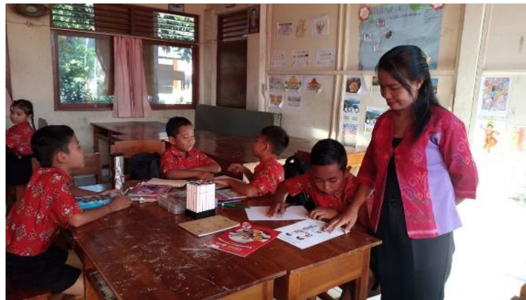
Gambar 2. Kegiatan Scaffolding kepada Peserta Didik

Selama proses pembelajaran berlangsung, guru melakukan pendampingan kepada peserta didik yang mengalami kesulitan dalam memahami materi maupun menyelesaikan tugas kelompok. Pendampingan dilakukan melalui pemberian arahan, pertanyaan bantuan, dan penjelasan tambahan sesuai kebutuhan peserta didik. Hasil observasi menunjukkan bahwa guru aktif berkeliling untuk memantau jalannya diskusi dan memberikan bantuan kepada kelompok yang memerlukan pendampingan.