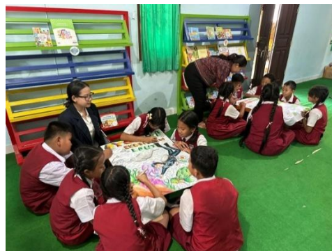
Gambar 2. Kegiatan Pengulangan Kembali Isi Cerita Dan Proses Pembuatan Poster

Keterlibatan siswa dalam kegiatan literasi juga terlihat pada aktivitas pengulangan kembali isi cerita dan pembuatan poster berdasarkan bacaan yang telah dibaca. Dalam kegiatan tersebut, siswa berusaha memahami isi bacaan kemudian mengekspresikan pemahamannya melalui karya yang dibuat. Sebagian siswa mampu menyampaikan kembali isi cerita secara runtut, sedangkan siswa lainnya menunjukkan pemahamannya melalui gambar dan tulisan pada poster. Dokumentasi kegiatan tersebut dapat dilihat pada Gambar 2.