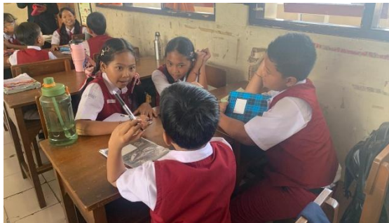
Gambar 1. Kegiatan Awal Literasi oleh Siswa Kelas IV

Hasil observasi menunjukkan bahwa kegiatan literasi membaca dilaksanakan sebelum pembelajaran dimulai. Siswa diberikan waktu sekitar 10–15 menit untuk membaca buku yang tersedia di pojok baca kelas maupun buku yang dibawa dari rumah. Selama kegiatan berlangsung, siswa tampak membaca secara mandiri dengan pendampingan guru. Guru mengawasi jalannya kegiatan serta memberikan arahan kepada siswa yang mengalami kesulitan dalam memahami bacaan. Pelaksanaan kegiatan awal literasi tersebut dapat dilihat pada Gambar 1.