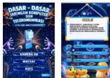
Gambar 2. Desain UI Aplikasi Lumina Envision

Tahap pengembangan media pembelajaran berbasis Augmented Reality (AR) dilakukan menggunakan aplikasi Unity 2022. Proses pengembangan memanfaatkan berbagai fitur untuk menghasilkan media pembelajaran yang interaktif, meliputi tampilan antarmuka, navigasi, objek tiga dimensi, animasi, serta integrasi teknologi Augmented Reality . Pengembangan dilakukan menggunakan bahasa pemrograman C# melalui Visual Studio Code dan didukung oleh Vuforia sebagai platform pendeteksi marker . Selain itu, objek tiga dimensi perangkat jaringan komputer dibuat menggunakan Blender 3D melalui proses pemodelan, pemberian texture , dan pengaturan shading . Hasil pengembangan berupa aplikasi Android berformat .apk yang dapat dijalankan pada sistem operasi Android minimal versi 10 (Q). Aplikasi terdiri atas beberapa menu, yaitu Splash Screen , menu awal, menu utama, informasi, kamera AR, materi, kuis, profil pengembang, dan tujuan pembelajaran. Tampilan antarmuka media pembelajaran berbasis Augmented Reality yang telah dikembangkan dapat dilihat pada Gambar 2.