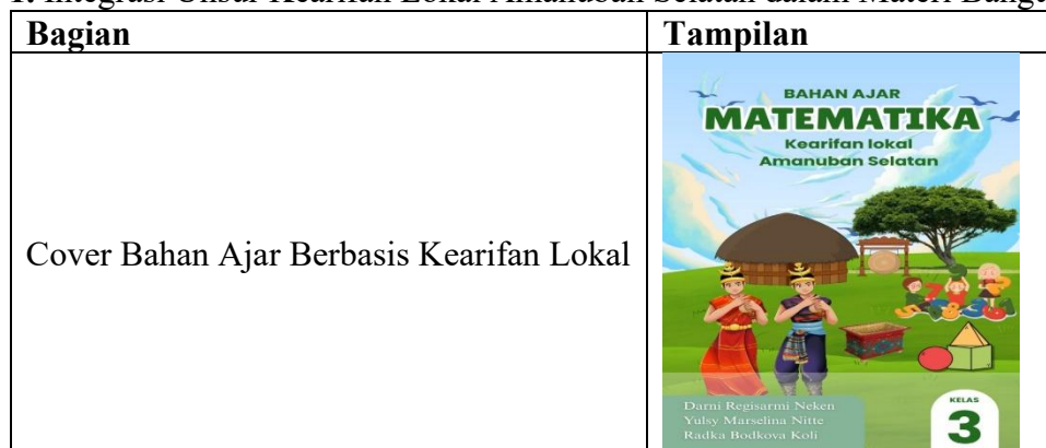
Tabel 1. Integrasi Unsur Kearifan Lokal Amanuban Selatan dalam Materi Bangun Datar

Pada tahap perancangan, peneliti menyusun desain bahan ajar sesuai dengan karakteristik siswa sekolah dasar. Bahan ajar dibuat dalam bentuk cetak dan digital (PDF) dengan ukuran A4 menggunakan jenis huruf Times New Roman dan tata letak yang menarik. Struktur bahan ajar meliputi sampul, kata pengantar, tujuan pembelajaran, materi inti, contoh soal kontekstual, latihan soal, rangkuman, dan evaluasi. Berikut merupakan tampilan cover bahan ajar yang dikembangkan pada Tabel 1.