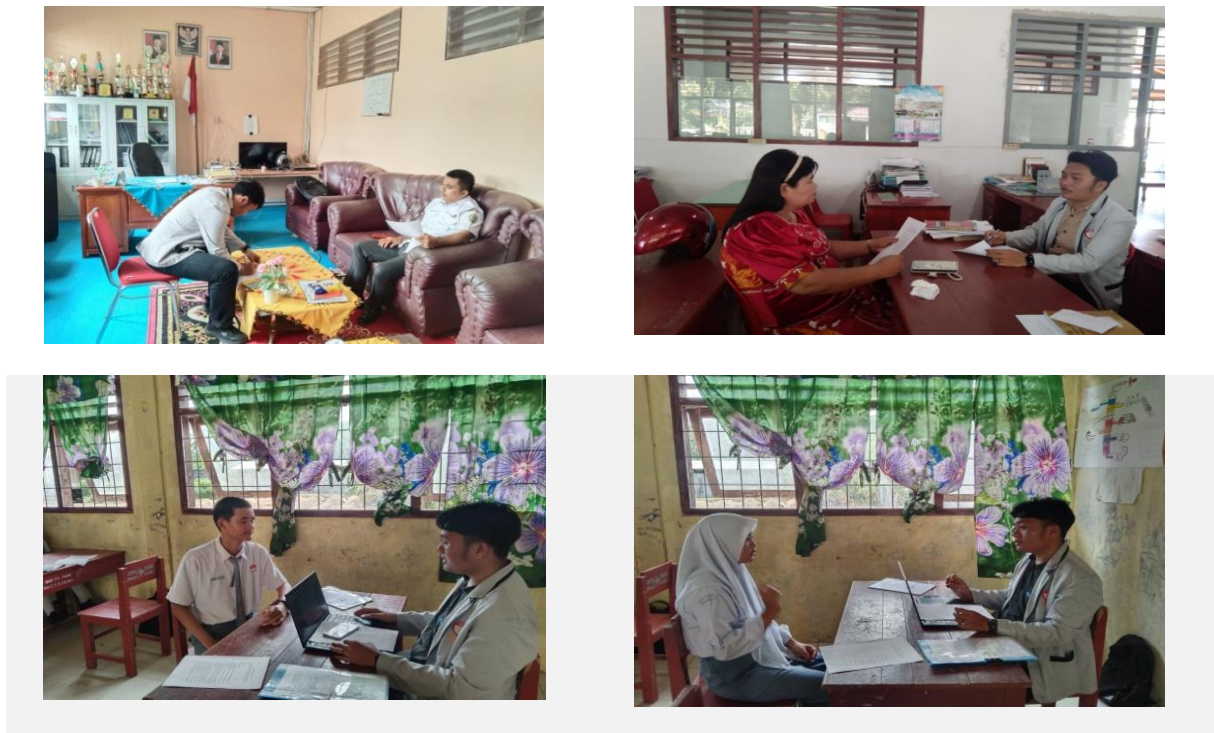
Gambar 1. Dokumentasi Wawancara dengan Kepala Sekolah, Guru dan Siswa

Untuk melengkapi deskripsi hasil penelitian, dokumentasi kegiatan wawancara disajikan sebagai bukti empiris dari proses pengumpulan data di lapangan. Dokumentasi ini merepresentasikan keterlibatan langsung informan dalam memberikan informasi yang relevan dengan fokus penelitian. Selain itu, penyajian visual ini bertujuan memperkuat validitas data melalui transparansi proses penelitian yang dilakukan. Gambar 1 menjadi bagian penting dalam menunjukkan konteks interaksi antara peneliti dan informan selama kegiatan wawancara berlangsung. Dengan demikian, dokumentasi ini tidak hanya bersifat ilustratif, tetapi juga mendukung kredibilitas temuan penelitian.