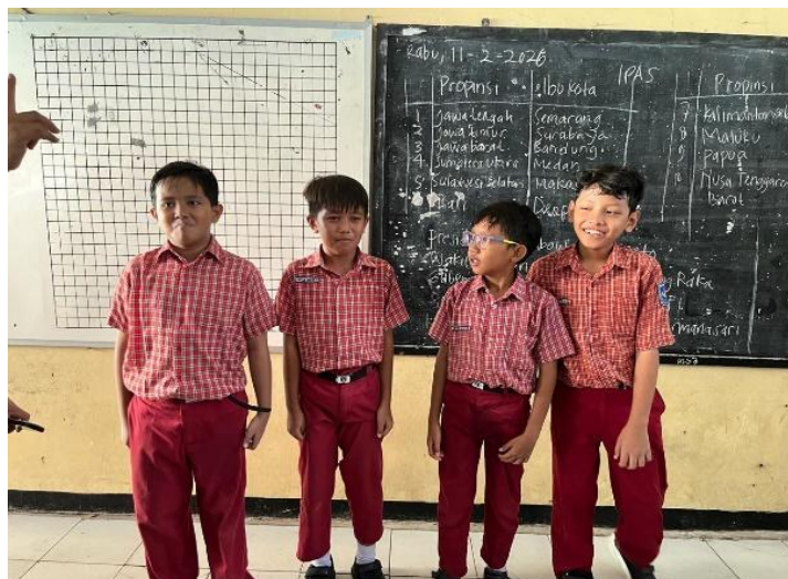
Gambar 1. Kegiatan Siswa Bercerita Tanpa Menggunakan Media Boneka Tangan

Pada siklus I, pembelajaran bercerita masih dilaksanakan tanpa menggunakan media boneka tangan. Berdasarkan hasil observasi, sebagian besar siswa belum menunjukkan keterlibatan yang optimal dalam kegiatan bercerita. Siswa cenderung kurang percaya diri ketika tampil di depan kelas, sehingga penyampaian cerita masih belum lancar dan kurang ekspresif. Selain itu, beberapa siswa mengalami kesulitan dalam menyusun alur cerita secara runtut serta menggunakan intonasi yang sesuai dengan isi cerita. Kondisi tersebut berdampak pada rendahnya partisipasi siswa selama pembelajaran dan belum tercapainya indikator keberhasilan yang ditetapkan. Gambaran kegiatan bercerita siswa pada kondisi awal dapat dilihat pada Gambar 1.