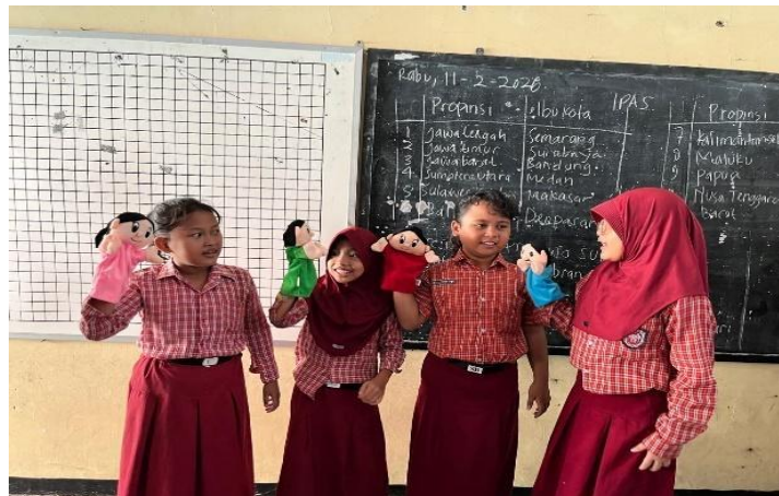
Gambar 2. Kegiatan Siswa Bercerita Menggunakan Media Boneka Tangan

Pada siklus I, aktivitas dan partisipasi siswa dalam pembelajaran masih tergolong rendah. Sebagian siswa terlihat pasif, kurang percaya diri, dan mengalami kesulitan dalam menyampaikan cerita secara runtut. Setelah penerapan media boneka tangan pada siklus II, terjadi peningkatan aktivitas belajar yang ditunjukkan melalui antusiasme siswa dalam mengikuti pembelajaran, keberanian tampil di depan kelas, serta kemampuan menyampaikan cerita dengan lebih jelas dan percaya diri. Pada siklus I masih ditemukan beberapa kendala dalam keterampilan bercerita siswa. Sebagian siswa belum mampu mengembangkan ide cerita secara runtut, berbicara dengan suara yang masih pelan, serta belum menggunakan ekspresi dan intonasi yang sesuai. Kondisi tersebut berdampak pada rendahnya kepercayaan diri siswa ketika tampil di depan kelas.