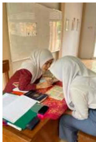
Gambar 2. Praktik Penggunaan Metode Talaqqi di SMA 45 Purwodadi

Berdasarkan Tabel 1, metode talaqqi memberikan perubahan positif terhadap kemampuan membaca Al-Qur'an peserta didik. Peningkatan tersebut tidak hanya terlihat pada kemampuan membaca, tetapi juga pada aspek afektif, seperti kepercayaan diri dan keaktifan peserta didik dalam mengikuti pembelajaran BTQ.