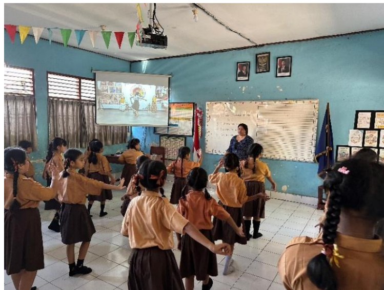
Gambar 2. Latihan Mejangeran

Berdasarkan Tabel 2, metode demonstrasi menjadi strategi yang paling sering digunakan guru dalam kegiatan mejangeran. Guru memperagakan gerakan tari secara langsung, kemudian peserta didik mengikuti gerakan tersebut secara bertahap. Selain itu, guru juga menggunakan metode bermain dan bernyanyi agar suasana pembelajaran menjadi lebih menyenangkan dan tidak membosankan bagi peserta didik kelas II. Hasil observasi menunjukkan bahwa peserta didik lebih mudah memahami gerakan tari ketika guru memberikan contoh secara langsung dan mendampingi selama proses latihan berlangsung.