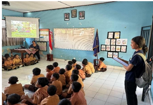
Gambar 1. Kegiatan Kokurikuler

dominan karena peserta didik dibiasakan untuk bekerja sama, saling membantu, dan menjaga kekompakan selama latihan berlangsung. Hasil observasi menunjukkan bahwa peserta didik mampu mengikuti kegiatan secara aktif dan antusias ketika melakukan latihan tari maupun bernyanyi bersama. Selain itu, hasil wawancara dengan guru wali kelas II menunjukkan bahwa kegiatan mejangeran tidak hanya bertujuan mengenalkan budaya Bali, tetapi juga menanamkan sikap kebersamaan dan saling menghargai antar peserta didik. Kegiatan ini dapat dilihat pad Gambar 1.