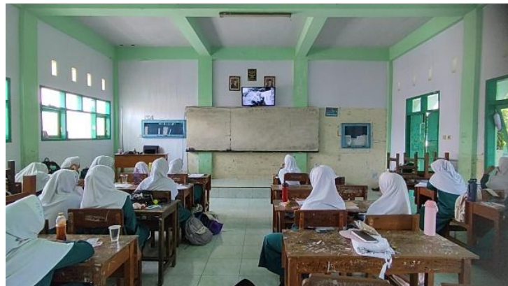
Gambar 2. Aktivitas modeling melalui media digital untuk memicu diskusi kritis siswa

Perkembangan karakter siswa juga tampak pada aspek kemandirian, kesabaran, dan rasa syukur. Siswa menjadi lebih mandiri dalam memahami materi dan menyelesaikan tugas yang diberikan guru. Dalam situasi tertentu, siswa mampu mengikuti pembelajaran dengan baik meskipun menghadapi kendala teknis yang terjadi selama penggunaan media digital. Selain itu, siswa menunjukkan sikap yang lebih positif terhadap proses pembelajaran dan mampu menghargai pengalaman belajar yang diperoleh. Temuan tersebut menunjukkan bahwa CTL berbasis digital tidak hanya mendukung peningkatan aspek akademik, tetapi juga berkontribusi terhadap penguatan karakter siswa.