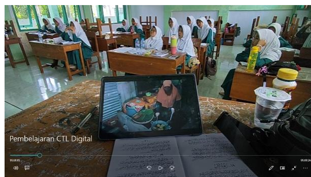
Gambar 1. Keterlibatan siswa dalam menyimak video pembelajaran kontekstual

Berdasarkan Tabel 1, implementasi CTL berbasis digital dilakukan melalui tiga aspek utama. Pertama, integrasi konten kontekstual dengan memanfaatkan video pembelajaran dan media digital yang relevan dengan kehidupan siswa untuk menanamkan nilai sabar dan syukur. Kedua, pembelajaran kolaboratif dan inkuiri yang diwujudkan melalui kegiatan diskusi, penyampaian pendapat, serta penyusunan pertanyaan terkait materi pembelajaran sehingga mendorong berkembangnya tanggung jawab dan kemandirian siswa. Ketiga, refleksi dan penilaian autentik yang dilakukan melalui kegiatan menyimpulkan pembelajaran serta pengamatan terhadap partisipasi siswa selama proses pembelajaran berlangsung. Ketiga aspek tersebut menunjukkan bahwa penerapan CTL berbasis digital tidak hanya menekankan pemahaman materi, tetapi juga mendukung penguatan nilai-nilai karakter dalam proses pembelajaran.