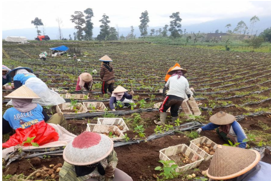
Gambar 1. Kegiatan Bertani

Hasil penelitian menunjukkan bahwa faktor pendukung utama dalam penanaman kemandirian anak berasal dari lingkungan keluarga dan sosial. Lingkungan pedesaan yang menjunjung nilai kerja keras dan gotong royong memberikan contoh nyata bagi anak dalam kehidupan sehari-hari. Kondisi ini memungkinkan anak belajar melalui pengamatan langsung terhadap aktivitas orang dewasa di sekitarnya. Sebagaimana disampaikan oleh informan, “Di sini anak-anak biasa lihat orang tuanya kerja, jadi mereka ikut terbiasa. Lingkungan juga saling membantu, jadi anak ikut belajar.” (Tokoh Masyarakat). Temuan ini menunjukkan bahwa lingkungan sosial memiliki peran penting dalam membentuk kebiasaan mandiri pada anak sejak usia dini, sebagaimana ditunjukkan melalui aktivitas bertani yang menjadi bagian dari kehidupan sehari-hari masyarakat pada Gambar 1.