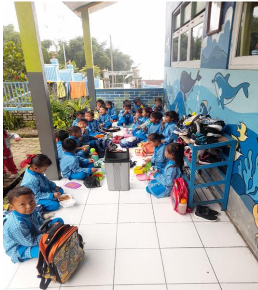
Gambar 2. Kemandirian Siswa PAUD di Lingkungan Sekolah.

Gambar 2 memperlihatkan perilaku mandiri siswa PAUD dalam aktivitas di sekolah, yang tercermin melalui kemampuan anak dalam mengelola kebutuhan pribadinya selama kegiatan berlangsung. Kemandirian tersebut tampak sebagai hasil dari proses pembiasaan yang terstruktur dalam lingkungan sekolah. Selain itu, perilaku ini juga menunjukkan adanya kesinambungan antara pengalaman belajar di rumah dengan praktik di sekolah. Dengan demikian, kemandirian anak terbentuk melalui interaksi yang saling menguatkan antara lingkungan keluarga dan lembaga pendidikan.