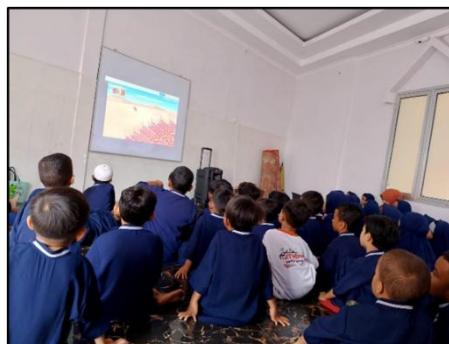
Gambar 1. Alat Pendukung Pembelajaran di TK Al-Hikmah

Penggunaan Dana BOP juga diarahkan untuk mendukung operasional pembelajaran dan kesejahteraan tenaga pendidik. Bendahara menyampaikan bahwa “ Dana BOP diprioritaskan untuk pembayaran gaji guru, administrasi pembelajaran, dan kebutuhan operasional kelas ” (02/H/B/TK/Al-Hikmah/2025). Hal ini menunjukkan bahwa keberlangsungan proses pembelajaran menjadi prioritas utama dalam penggunaan anggaran. Dengan terpenuhinya kebutuhan operasional, proses belajar mengajar dapat berjalan tanpa hambatan. Hal tersebut dapat dilihat pada penyediaan berbagai alat pendukung pembelajaran yang tersedia di sekolah, sebagaimana ditunjukkan pada Gambar 1 berikut.