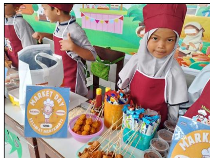
Gambar 2. Pengadaan Market Day di TK Al-Hikmah

Selain itu, Dana BOP juga dimanfaatkan untuk pengembangan kompetensi guru melalui berbagai kegiatan pelatihan. Wakil kepala sekolah menyatakan bahwa “Dana digunakan untuk kegiatan PKG, KKG, MGMP, workshop, dan pelatihan dengan menghadirkan narasumber dari luar” (03/RV/WK/TK/Al-Hikmah/2025). Kegiatan ini bertujuan untuk meningkatkan profesionalisme guru dalam melaksanakan pembelajaran. Dengan meningkatnya kompetensi guru, kualitas pembelajaran yang diberikan kepada siswa juga semakin baik. Penggunaan dana juga mencakup kegiatan pembelajaran berbasis pengalaman dan ekstrakurikuler. Wakil kepala sekolah menjelaskan bahwa “Dana BOP digunakan untuk mendukung kegiatan kunjungan belajar, observasi lapangan, dan kegiatan ekstrakurikuler” (03/RV/WK/TK/Al-Hikmah/2025). Kegiatan ini memberikan pengalaman belajar yang lebih luas bagi peserta didik di luar kelas. Dengan demikian, pembelajaran tidak hanya terbatas pada ruang kelas, tetapi juga melibatkan pengalaman langsung di lingkungan sekitar. Implementasi kegiatan pembelajaran berbasis pengalaman tersebut dapat dilihat pada kegiatan Market Day yang diselenggarakan sekolah, sebagaimana ditampilkan pada Gambar 2 berikut.