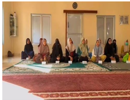
Gambar 3 Pertemuan Antara Wali Murid

Pelaporan Dana BOP dilakukan secara periodik dua kali dalam setahun melalui sistem daring. Bendahara menyampaikan bahwa “ Laporan keuangan dibuat pada bulan Juni dan Desember serta diunggah ke portal BOP ” (02/H/B/TK/Al-Hikmah/2025). Sistem pelaporan ini memungkinkan monitoring yang lebih efektif oleh pihak terkait. Selain itu, pelaporan berkala juga membantu sekolah dalam melakukan evaluasi penggunaan dana secara berkelanjutan. Pengawasan terhadap penggunaan dana dilakukan oleh berbagai pihak, baik internal maupun eksternal. Kepala sekolah menyatakan bahwa “ Pengawasan dilakukan oleh komite sekolah dan Kementerian Agama melalui audit dan monitoring ” (01/AH/Kepsek/TK/Al-Hikmah/2025). Selain itu, laporan pertanggungjawaban juga disampaikan kepada orang tua sebagai bentuk transparansi publik. Dengan demikian, pengelolaan Dana BOP tidak hanya akuntabel secara administratif, tetapi juga terbuka kepada masyarakat. Bentuk transparansi tersebut salah satunya diwujudkan melalui pertemuan dengan wali murid, sebagaimana ditunjukkan pada Gambar 3 berikut.