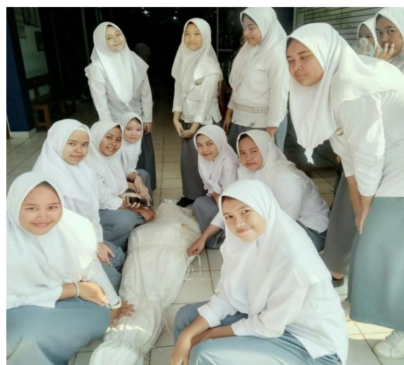
Gambar 2. Foto Kegiatan Pemulasaraan Jenazah di SMA Muhammadiyah Pamulang