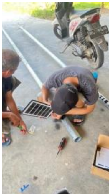
Gambar 2. Pemasangan Lampu