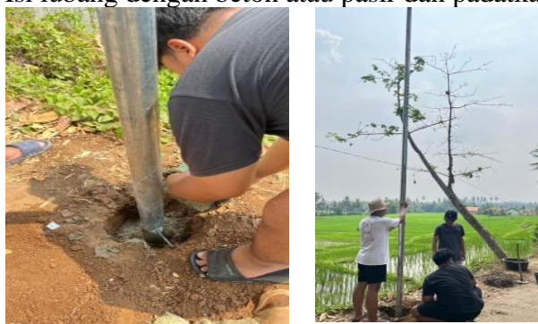
Gambar 1. Pemasangan tiang