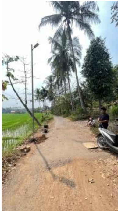
Gambar 3. Hasil pemasangan Lampu