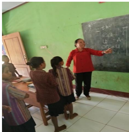
Gambar 6. Menjelaskan Fonem

Pada tahap ini, fokus pembelajaran terkait kosakata benda kongkrit yang dikhususkan pada nama-nama tempat dan profesi yang ada dikampung. Selain itu fokus pada kegiatan ini adalah mengetahui Fonem bahasa Inggris dimana fonem tersebut berasal dari kata benda yang diajarkan. Tujuan pada tahap ini adalah membangun pemahaman peserta didik terkait cara membaca teks bahasa Inggris yang berbeda tulisan dan pelafalannya. Semua peserta didik terlibat aktif dalam kegiatan ini. Kegiatan penjelasan fonem tersebut ditampilkan pada Gambar 6.