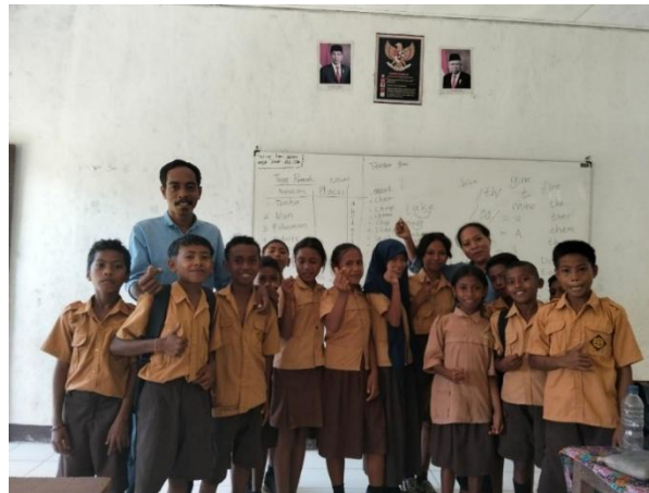
Gambar 1. Observasi Belajar

Berdasarkan Gambar 1, peneliti melakukan observasi kegiatan pembelajaran secara langsung di kelas bersama guru dan siswa. Observasi ini menunjukkan adanya interaksi yang aktif dan suasana belajar yang kondusif selama proses pembelajaran berlangsung. Selain itu, terlihat bahwa siswa mengikuti kegiatan pembelajaran dengan antusias dan menunjukkan keterlibatan yang baik dalam aktivitas kelas. Kegiatan observasi ini dilakukan untuk memperoleh data mengenai pelaksanaan pembelajaran serta kondisi lingkungan belajar di sekolah.