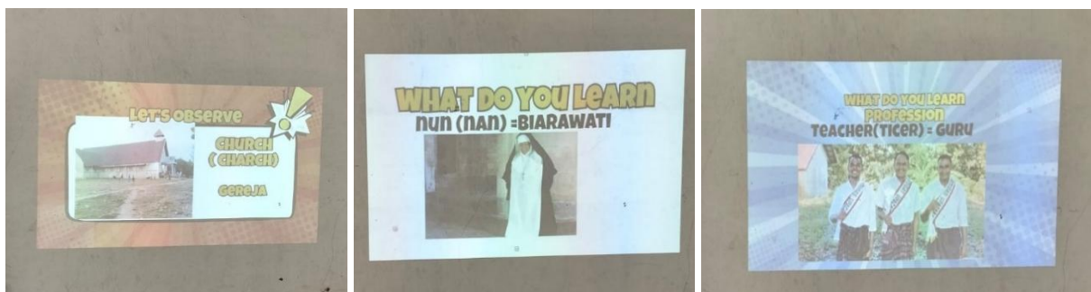
Gambar 2. Tempat dan Profesi

Peserta didik diminta mengamati gambar tempat dan profesi yang familiar di lingkungan desa seperti sekolah, posyandu, gereja, kebun, sungai, kantor desa, guru, bidan, nelayan, petani, biarawati, dan kepala desa. Peserta didik terlihat lebih aktif karena materi yang digunakan dekat dengan kehidupan sehari-hari mereka. Pelaksanaan kegiatan pengenalan kosakata tempat dan profesi berbasis lingkungan sekitar peserta didik ini disajikan pada Gambar 2.