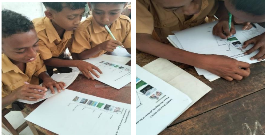
Gambar 7. Latihan Soal Dengan Matching Pictures and Words

Seperti terlihat pada Gambar 7, peserta didik mengikuti kegiatan latihan dengan mencocokkan gambar dan kosakata Bahasa Inggris sesuai materi yang telah dipelajari sebelumnya. Kegiatan ini membantu peserta didik memperkuat pemahaman kosakata melalui media visual yang menarik dan mudah dipahami. Selain itu, peserta didik juga mengerjakan latihan fill in the blank untuk melatih kemampuan memahami makna kata dan penggunaan kosakata dalam konteks sederhana. Melalui kegiatan latihan ini, peserta didik terlihat aktif, antusias, dan lebih percaya diri dalam mengerjakan soal Bahasa Inggris secara mandiri.