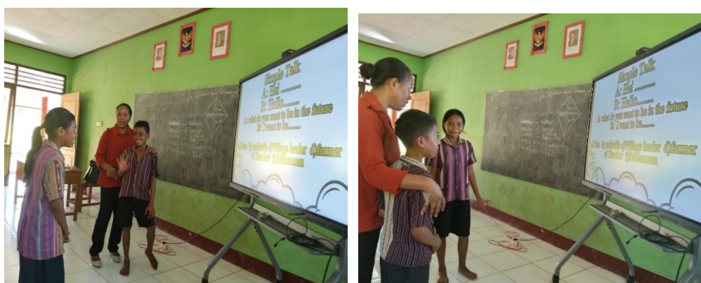
Gambar 5. Latihan Speaking dan Speaking Pair

Pada tahap ini, peserta didik diajak untuk melakukan dialog sederhana berpasangan. Dialog ini berisikan pertanyaan dan cita-cita sesuai dengan materi yang diajarkan, Tujuan dari dialog ini agar peserta didik mampu berbicara bahasa Inggris dengan baik serta memperkuat materi ajar terkait Fonem dan juga memperkaya kosakata mereka. Peserta didik terlihat antusias terlibat dalam dialog ini di depan kelas. Interaksi pembelajaran pada tahap ini dapat diamati pada Gambar 5.