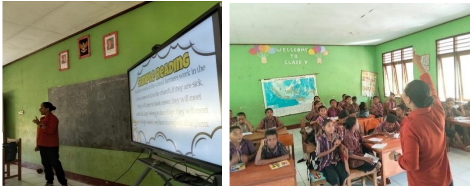
Gambar 4. Membaca Teks dan Menjawab Pertanyaan Dari Teks

dalam bagian ini. Rangkaian kegiatan membaca teks sederhana dan menjawab pertanyaan bersama peserta didik dapat dilihat pada Gambar 4.