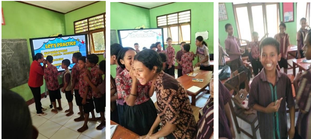
Gambar 9. Whisper Games

Pada tahap ini, peserta didik diajak terlibat dalam permainan edukatif whisper games and guessing game . Tujuannya agar peserta didik terhindar dari kejenuhan belajar. Selain itu model permainan ini juga tidak terlepas dari materi ajar sehingga peserta didik dapat mengingat materi dengan baik. Semua peserta didik terlibat aktif dalam kegiatan ini. Pelaksanaan kegiatan whisper games bersama peserta didik ditampilkan pada Gambar 9.