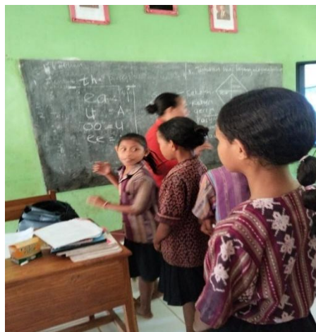
Gambar 3. Siswa Mengikuti Kegiatan Game Membaca

Pada tahap ini, peserta didik diajak untuk membaca kosakata yang disertai dengan ilustrasi/gambar. Pada tulisan kosakatanya disertai dengan cara membaca dan dijelaskan alasan mengapa kata tersebut dibaca berbeda dengan tulisannya. Pada kesempatan ini, peserta didik diajarkan fonem bahasa Inggris. Fonem yang diajarkan seperti /ee/, /oo/, /ch/, /ie/, /ae/, /th/, /ou/. Tujuan diajarkan fonem agar membantu peserta didik membaca teks sederhana yang telah dirancang. Pelaksanaan pembelajaran fonem dan latihan membaca kosakata bersama peserta didik tersebut ditunjukkan pada Gambar 3.