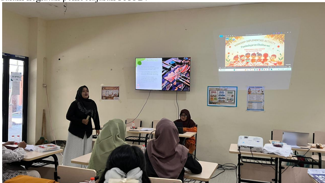
Gambar 2. pemaparan materi oleh narasumber

Tahap pelatihan kemampuan guru menunjukkan hasil yang signifikan dalam meningkatkan pemahaman guru terkait konsep ekoliterasi dan integrasinya dengan budaya lokal Sukoharjo. Pelatihan diawali dengan pemaparan materi oleh narasumber mengenai konsep dasar ekoliterasi, pentingnya pembelajaran berbasis lingkungan, serta integrasi budaya lokal dalam kegiatan pembelajaran PAUD.