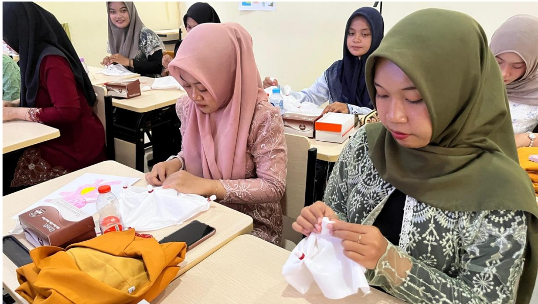
Gambar 3. Peserta praktik membuat

Setelah penyampaian materi, guru diberikan kesempatan untuk berdiskusi dan melakukan praktik langsung dalam merancang activity pembelajaran, seperti menyusun langkah praktik kegiatan membuat. Pada tahap praktik, guru secara aktif mencoba menerapkan skenario pembelajaran yang telah disusun dengan bimbingan tim pelaksana. Peserta sangat antusias dalam melakukan kegiatan membuat.