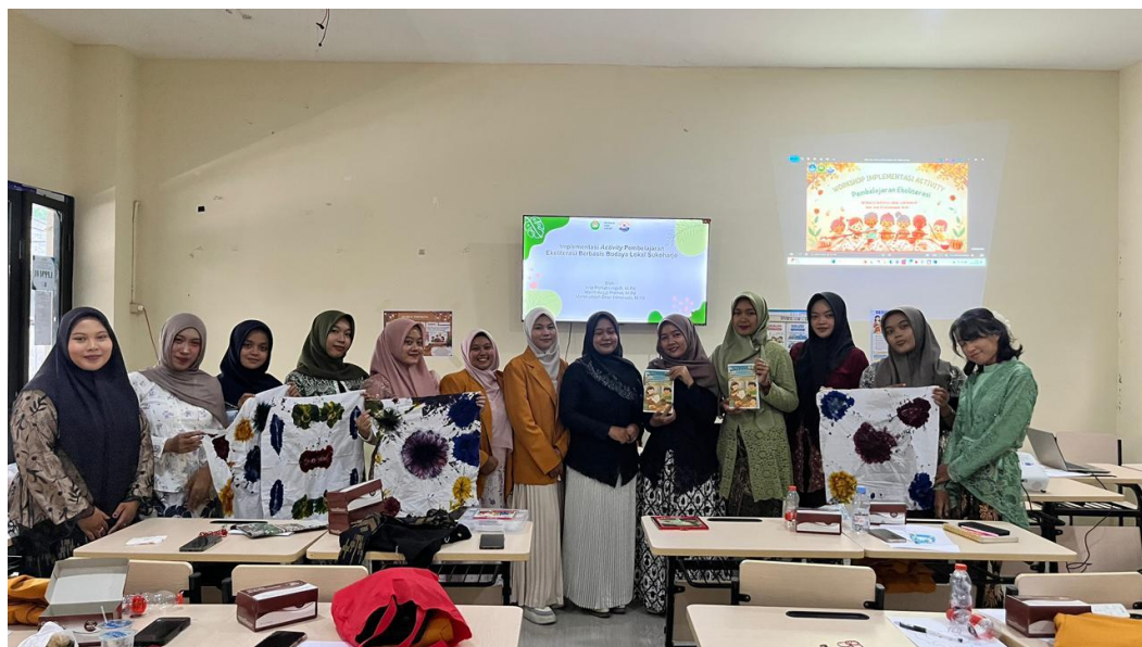
Gambar 5. Foto Bersama dengan peserta

bersama serta dokumentasi berupa foto bersama sebagai bentuk hasil dan luaran kegiatan pelatihan ekoliterasi yang telah dilaksanakan.