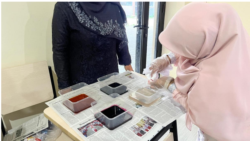
Gambar 4. Peserta praktik batik celup

Sebelum pelatihan, sebagian besar guru masih memaknai ekoliterasi secara terbatas pada kegiatan sederhana seperti menjaga kebersihan dan menanam. Namun setelah pelatihan dan praktik langsung, guru mulai mampu mengembangkan aktivitas yang lebih variatif, kontekstual, dan terintegrasi dengan budaya lokal. Kegiatan pelatihan diakhiri dengan refleksi