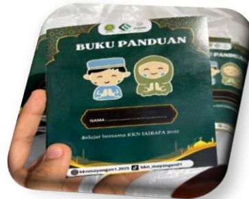
Gambar 2. Buku Panduan Keagamaan

mengungkapkan bahwa kombinasi rangsangan visual dan auditori dapat memperkuat daya ingat dan pemahaman peserta didik.