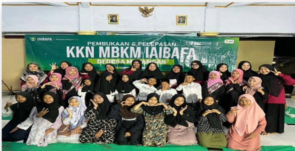
Gambar 4. Foto Bersama Anak-Anak Desa Mayangan saat Penutupan dan Apresiasi

Dengan demikian, program pengabdian ini tidak hanya meningkatkan pemahaman agama anak-anak, tetapi juga memperkuat jaringan sosial dalam komunitas serta memperkaya budaya belajar yang partisipatif. Pendekatan ini membangun rasa kebersamaan dan saling mendukung antaranggota komunitas, yang sangat penting dalam keberlanjutan program pendidikan. Selain itu, keterlibatan aktif berbagai pihak seperti pengurus masjid dan orang tua menjadi kunci sukses implementasi model ini. Model pembelajaran ini berpotensi untuk diterapkan di komunitas lain dengan karakteristik yang sama untuk mendukung pendidikan agama yang lebih efektif dan menyenangkan. Dengan adaptasi yang tepat, strategi ini dapat menjadi contoh terbaik dalam pemberdayaan masyarakat melalui pendidikan (Amirullah et al., 2021; Hosaini et al., 2024; Nurlina et al., 2023; Parnawi et al., 2024).