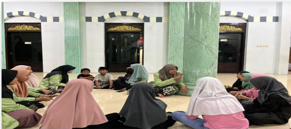
Gambar 3. Proses Pembelajaran

Di samping aspek kognitif, pendekatan Asset-Based Community Development (ABCD) yang diterapkan memberikan kesempatan bagi pemberdayaan masyarakat melalui pemanfaatan aset lokal yang ada, seperti partisipasi pengurus masjid dan dukungan dari orang tua. Pendekatan ini sejalan dengan prinsip pemberdayaan masyarakat yang menekankan pentingnya potensi internal komunitas sebagai dasar suksesnya program. Oleh karena itu, strategi ini tidak hanya berfokus pada individu, tetapi juga memperkuat jaringan sosial di dalam komunitas. Dalam konteks ini, partisipasi aktif dari anak-anak serta dukungan dari masyarakat menunjukkan keberhasilan ABCD dalam memaksimalkan sumber daya lokal untuk pendidikan agama. Keberhasilan tersebut menjadi bukti bahwa pemberdayaan berbasis aset lokal mampu menciptakan dampak positif yang berkelanjutan (Khasanah et al., 2024; Ma et al., 2024; Mulyana et al., 2025; Waluyo & Piliyanti, 2023).