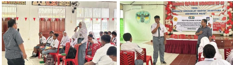
Gambar 2. Diskusi Interaktif dan Tanya Jawab Peserta dalam Penyuluhan

Berdasarkan hasil pre-test yang disajikan pada Tabel 1, kegiatan dilanjutkan dengan penyampaian materi hukum secara interaktif mengenai bentuk-bentuk kekerasan seksual, dasar hukum perlindungan anak, dan mekanisme pelaporan. Pada tahap ini, siswa tidak hanya mendengarkan materi, tetapi juga terlibat aktif dalam tanya jawab dan diskusi. Interaksi antara narasumber dan peserta dalam proses penyuluhan tersebut terlihat pada Gambar 2. Keterlibatan aktif siswa ini penting karena menunjukkan bahwa proses edukasi tidak berlangsung satu arah, melainkan membangun partisipasi peserta dalam memahami persoalan kekerasan seksual secara lebih dekat dengan realitas mereka.