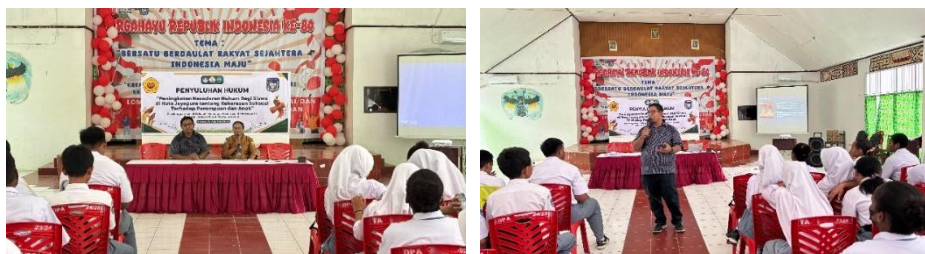
Gambar 1. Suasana Pembukaan dan Penyampaian Materi Penyuluhan Hukum

Kegiatan pengabdian kepada masyarakat ini dilaksanakan pada tanggal 26 Agustus 2025 di SMK Negeri 5 Seni dan Industri Kreatif Jayapura dengan melibatkan 43 siswa sebagai peserta utama dan didampingi oleh dua orang guru pendamping. Kegiatan berlangsung dalam tiga sesi, yaitu pembukaan dan ice breaking hukum, materi inti dan interaksi, serta penutup. Pada sesi inti, kegiatan dilaksanakan melalui penyampaian materi hukum, diskusi tanya jawab, diskusi kelompok berbasis studi kasus, simulasi peran ( role play ), simulasi persidangan semu ( moot court ), serta penulisan pesan kampanye anti-kekerasan oleh peserta. Rangkaian pelaksanaan kegiatan tersebut dapat dilihat melalui dokumentasi pada Gambar 1, yang menunjukkan suasana pembukaan dan penyampaian materi kepada peserta.