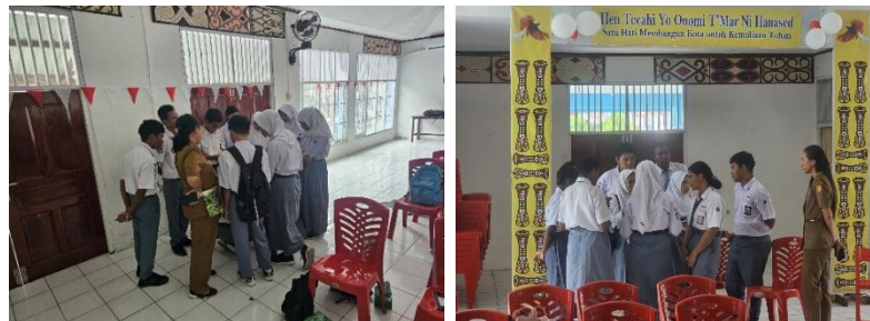
Gambar 3. Diskusi Kelompok Berbasis Studi Kasus

Sebagaimana ditunjukkan pada Gambar 2, proses pembelajaran dilanjutkan dengan diskusi studi kasus secara berkelompok. Kegiatan ini bertujuan untuk memperdalam pemahaman siswa terhadap situasi nyata yang mungkin terjadi di lingkungan sekolah maupun ruang digital, sebagaimana terlihat pada Gambar 3. Melalui studi kasus tersebut, siswa mulai memahami berbagai bentuk kekerasan yang dapat muncul dalam kehidupan sehari-hari. Selain itu, siswa juga menyadari bahwa budaya diam dan pembiaran sering kali menjadi faktor yang membuat pelaku kekerasan merasa aman dan tidak tersentuh oleh mekanisme hukum.