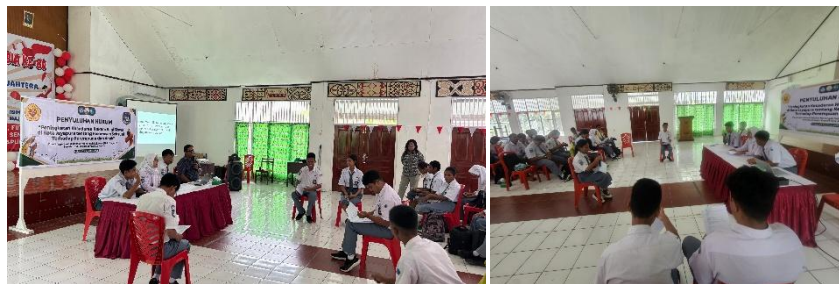
Gambar 5. Simulasi Moot Court Tentang Kekerasan Seksual Di Lingkungan Sekolah

Mengacu pada Gambar 4, kegiatan selanjutnya adalah simulasi moot court sederhana sebagai bagian dari pembelajaran berbasis pengalaman. Dalam simulasi ini, siswa berperan sebagai hakim, jaksa, saksi, korban, penasihat hukum, dan terdakwa, sehingga mereka dapat melihat secara langsung bagaimana suatu kasus kekerasan seksual diproses dalam sistem hukum. Pelaksanaan simulasi persidangan semu tersebut ditunjukkan pada Gambar 5. Melalui kegiatan ini, siswa memahami bahwa kekerasan seksual merupakan tindak pidana yang memiliki konsekuensi hukum dan bukan sekadar persoalan moral atau persoalan privat yang harus disembunyikan.