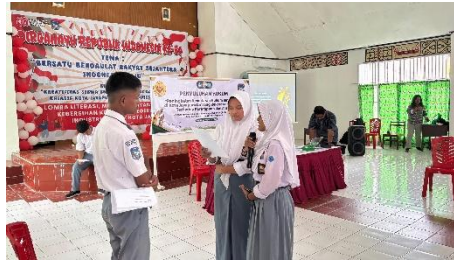
Gambar 4. Simulasi Peran ( Role Play ) Sebagai Media Pembelajaran Perlindungan Diri

Mengacu pada Gambar 4, kegiatan selanjutnya adalah simulasi moot court sederhana sebagai bagian dari pembelajaran berbasis pengalaman. Dalam simulasi ini, siswa berperan sebagai hakim, jaksa, saksi, korban, penasihat hukum, dan terdakwa, sehingga mereka dapat melihat secara langsung bagaimana suatu kasus kekerasan seksual diproses dalam sistem hukum. Pelaksanaan simulasi persidangan semu tersebut ditunjukkan pada Gambar 5. Melalui kegiatan ini, siswa memahami bahwa kekerasan seksual merupakan tindak pidana yang memiliki konsekuensi hukum dan bukan sekadar persoalan moral atau persoalan privat yang harus disembunyikan.