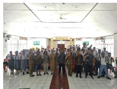
Gambar 7. Foto Bersama dan Komitmen Anti-Kekerasan Seksual Di Akhir Kegiatan

Selain peningkatan pada aspek kognitif, kegiatan ini juga menghasilkan penguatan pada aspek sikap dan komitmen siswa. Setelah seluruh rangkaian kegiatan selesai, siswa mengikuti refleksi kolektif dan pembacaan komitmen lisan untuk menolak kekerasan seksual, saling menjaga, dan berani melapor apabila mengalami atau menyaksikan pelanggaran. Suasana penutupan dan foto bersama peserta dapat dilihat pada Gambar 7. Dokumentasi ini memperlihatkan bahwa kegiatan tidak hanya menghasilkan pengetahuan, tetapi juga membangun kesiapan sikap sebagai bagian dari pembentukan budaya sekolah yang aman dan berpihak kepada korban.