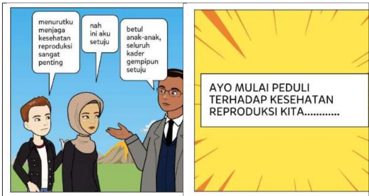
Gambar 2. Penggunaan dialog dan kalimat yang mengantarkan pembaca pada akhir cerita komik.

Gambar 1 dan 2 di atas menunjukkan upaya perbaikan yang telah dilakukan terutama pada bagian judul komik dan akhir komik.