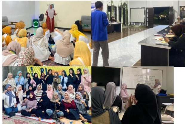
Gambar 1. Kegiatan Diskusi dan Pengkaderan KOPRI PMII UIN Mataram

keputusan dan aktivitas strategis. Meskipun demikian, beberapa informan mengakui bahwa budaya patriarki masih muncul dalam bentuk stereotip terhadap kemampuan perempuan dalam memimpin organisasi. Kondisi ini menunjukkan bahwa proses integrasi nilai Islam dan modernitas dalam konstruksi gender di PMII masih berlangsung secara dinamis dan memerlukan penguatan kesadaran kolektif seluruh kader organisasi. Dokumentasi kegiatan tersebut dapat dilihat pada Gambar 1 berikut.